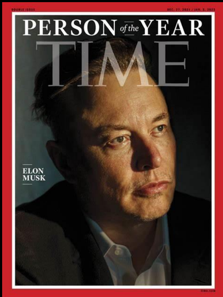
《时代》周刊2021年度人物